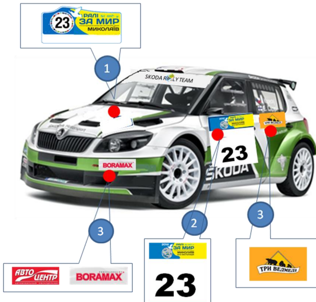
СХЕМА РОЗМІЩЕННЯ СТАРТОВИХ (ІДЕНТИФІКАЦІЙНИХ) НОМЕРІВ ТА ПОЗНАЧЕНЬ НА АВТОМОБІЛІ

Додаток 2 До додаткового регламенту 2-го етапу Чемпіонату України з міні- ралі «Кубок Лиманів» 2015 р. ралі «КУЯЛЬНИК»